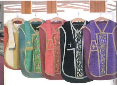
Unikátní výstava liturgických předmětů