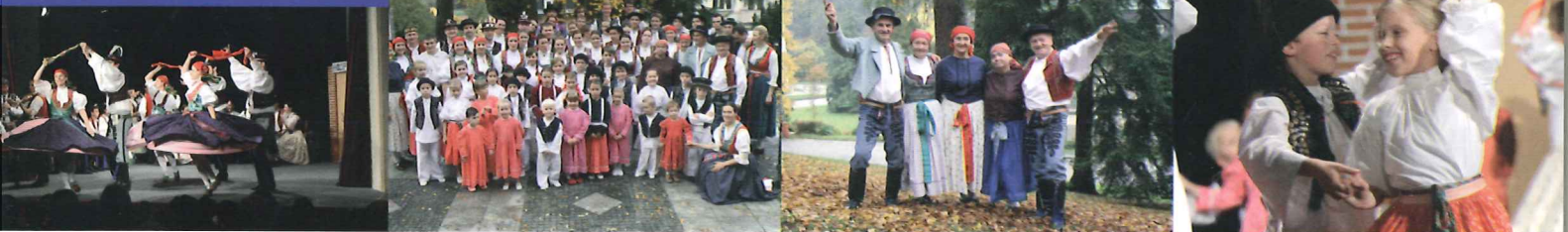
50. výročí založení folklorního souboru Malé Zálesí