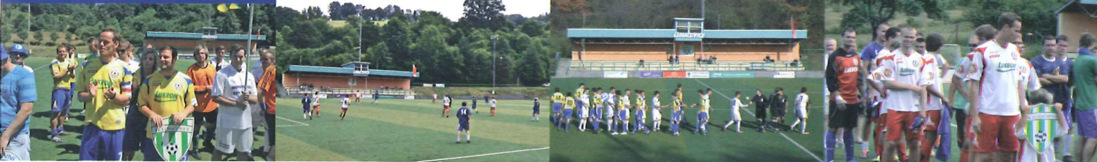
100. výročí Fotbalového klubu