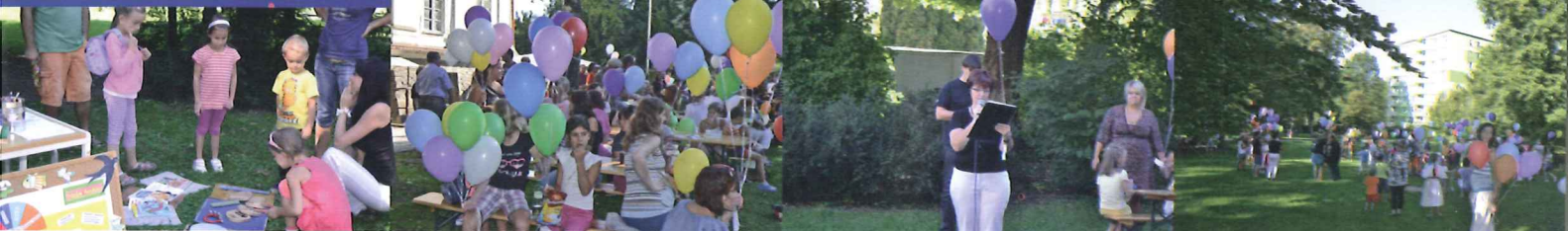
30. výročí založení Domu dětí a mládeže