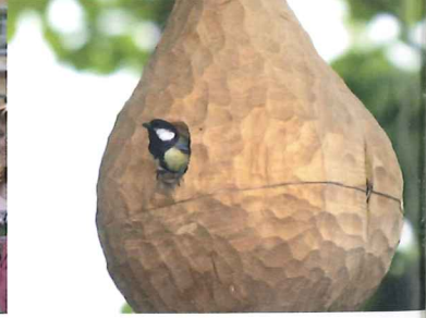
Pěší stezka ptačích krmítek a budek ve stylu externí výstavní galerie otevřena