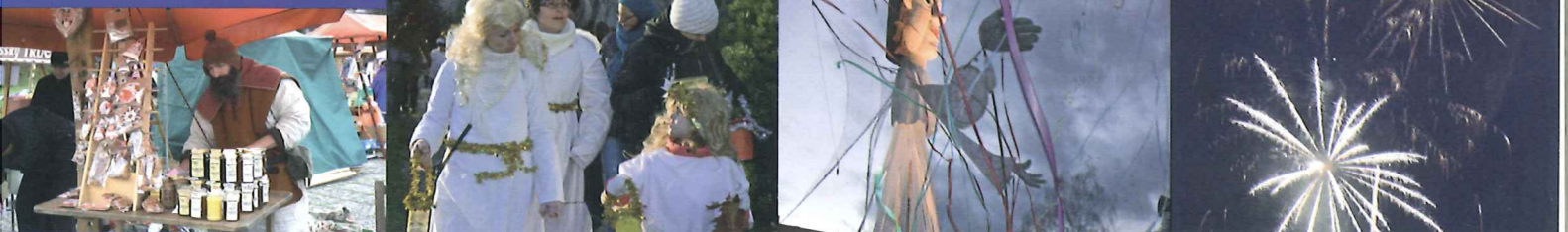
Tradiční Vánoční jarmark s ohňostrojem