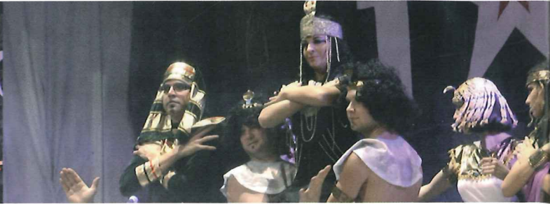
Ráz 73. šibřinek Luhačovice mají talent