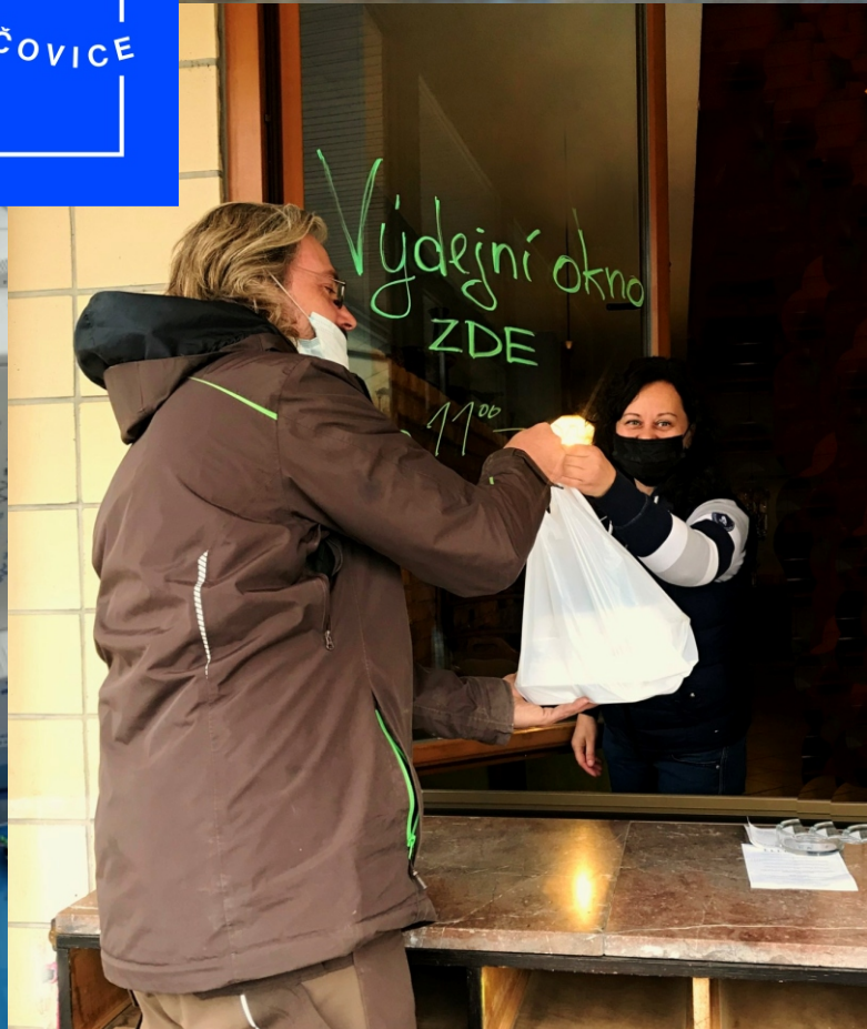
Tady pramení události