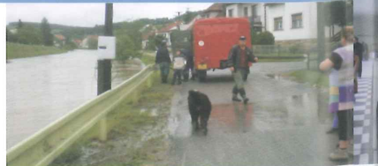
Druhý stupeň povodňové aktivity na řece Štávnici. Nejhorší situace je v místní části Polichno.