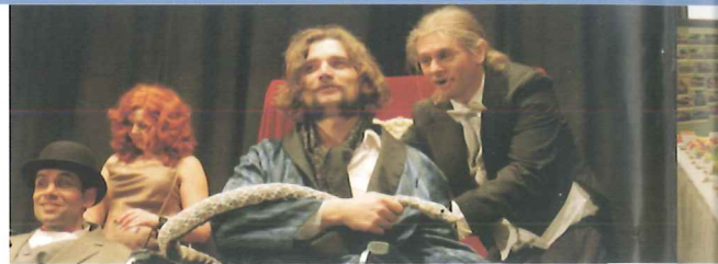
Premiéra Jercules Parrot a vraždy v lázních divadelního spolku "Jednou za rok?".