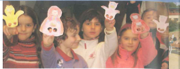
Výstava loutek a loutkových rodinných divadel v galerii MĚDK Elektra.