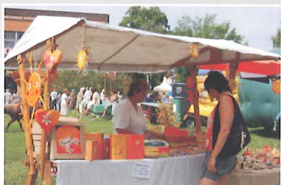
V neděli 13. července se slavila Luhačovická pouť.