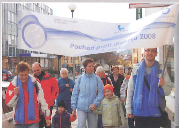
Pochod proti diabetu 14. listopadu.