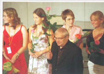
Kmotrem přehlídky komorní divadelní tvorby „Divadelní Luhačovice“ byl známý divadelník Jiří Suchý.