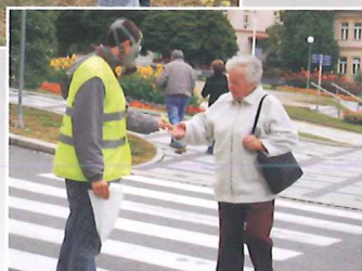
Do Evropského týdne mobility a Evropského dne bez aut, konaných pod záštitou Ministerstva životního prostředí, se zapojily ve dnech 16.–22. září i ZŠ Luhačovice, Dům dětí a mládeže Luhačovice, Policie ČR, Městská policie Luhačovice a město Luhačovice.