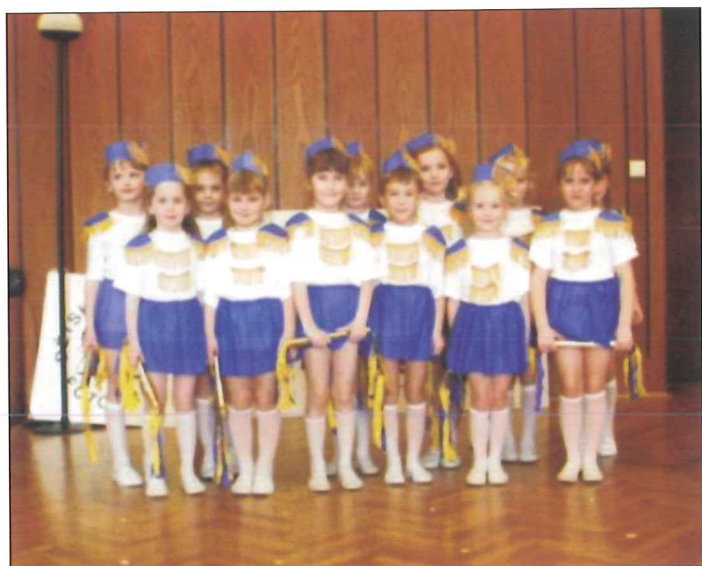
Malé mažoretky z MŠ Luhačovice na soutěži Mateřinky ve Zlíně v březnu.