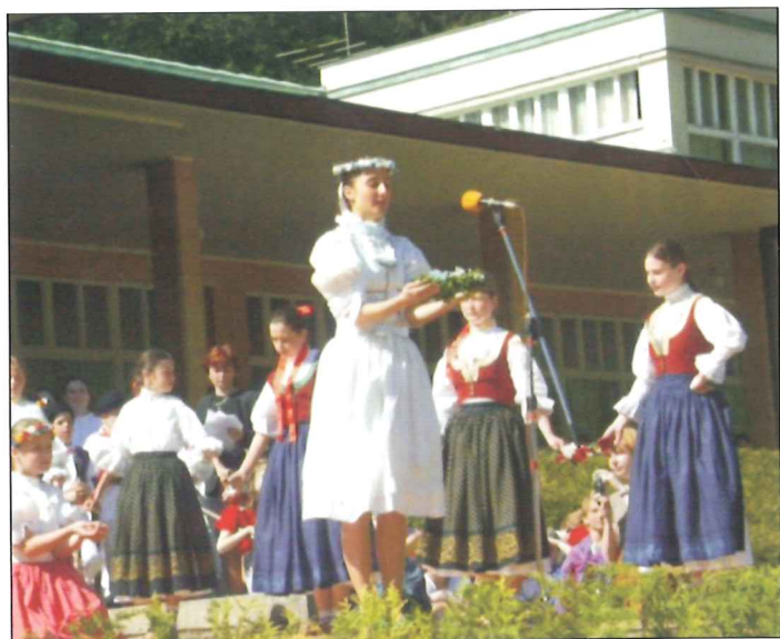
Slavnostní zahájení lázeňské sezóny - Otevirání pramenů v květnu.