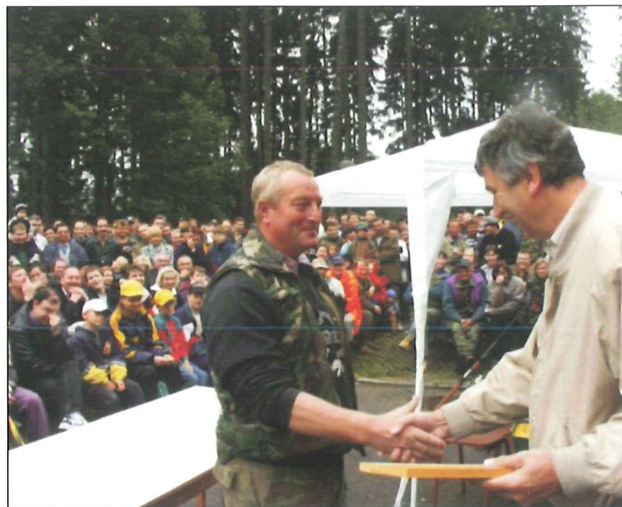
Starosta města blahopřeje vítězi Podzimních rybářských závodů.