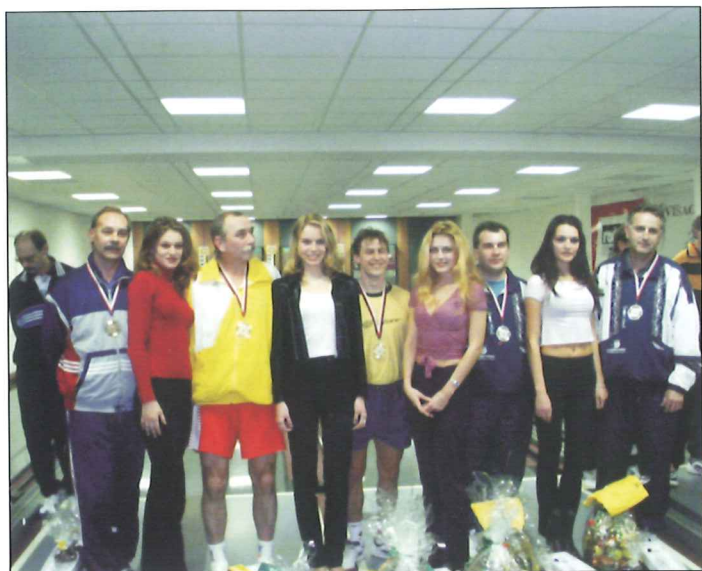
V sobotu 6. ledna 2001 se na luhačovické kuželně uskutečnilo velkolepé Finále kuželkářské soutěže dvojic mužů (Mistrovství ČR dvojic pro rok 2001)