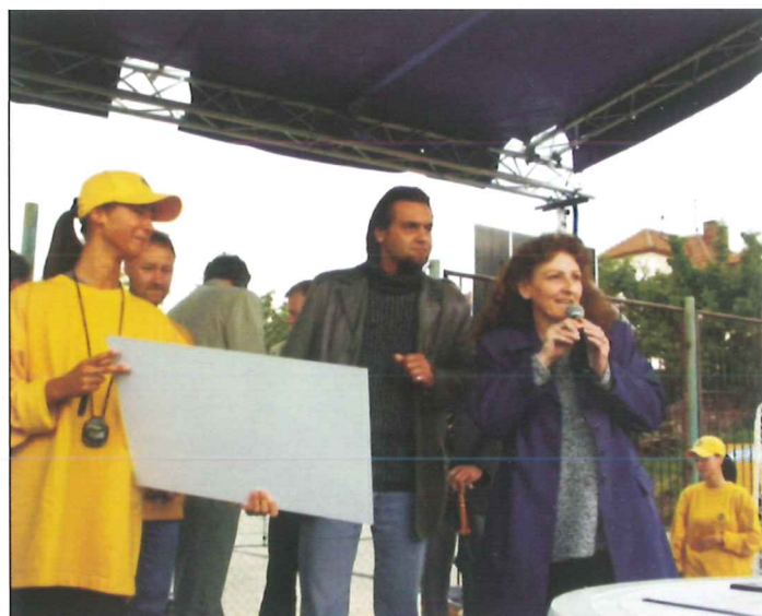
Ředitelka ZŠ přebírá nové hřiště, které získali žáci školy díky výhře v soutěži Opavia dětem.