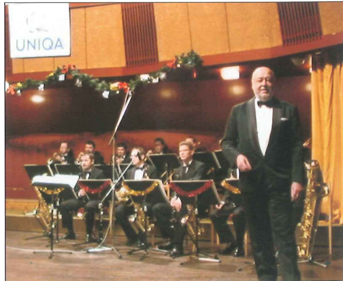
V prosinci se místní senioři bavili s Orchestrem Václava Hybše.