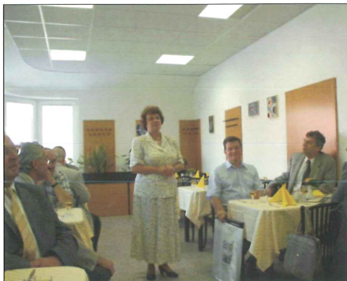
Návštěva představitelů družebního města Ustroň.