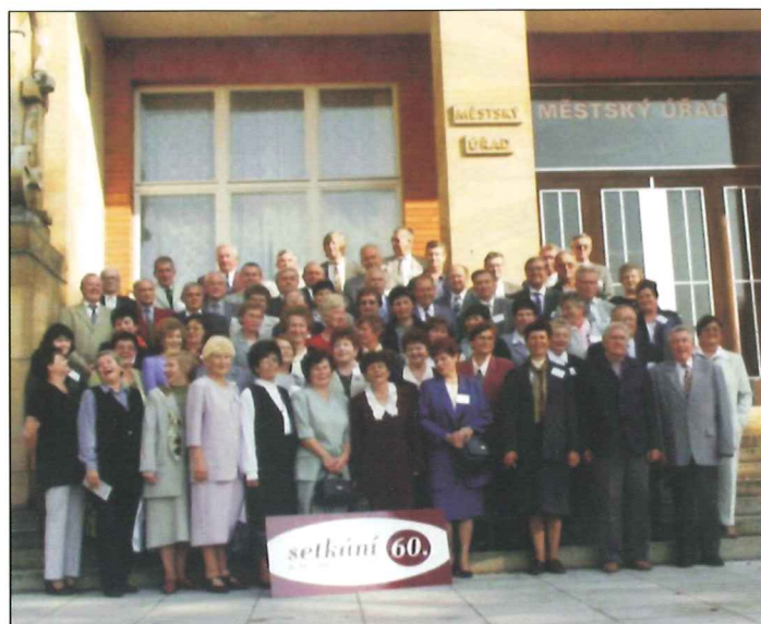
Šedesátníci na Radnici společně s místostarostou.