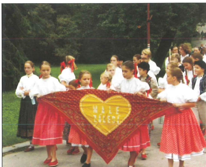
Soubor Malé Zálesí na Mezinárodním festivalu dětských folklórních souborů v Luhačovicích.