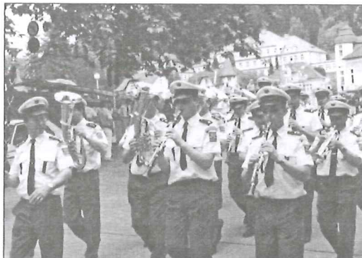
Hudba Hradní stráže a Policie ČR pochoduje ulicemi města před svým vynikajícím koncertem, který zpestřil letní sezónu.