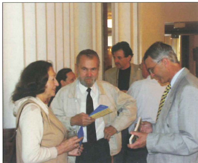
Účastníci Mezinárodního setkání spisovatelů na Radnici.