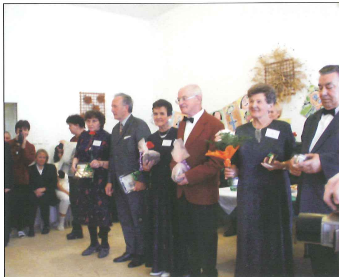
Taneční soutěž v Domově důchodců v Luhačovicích.