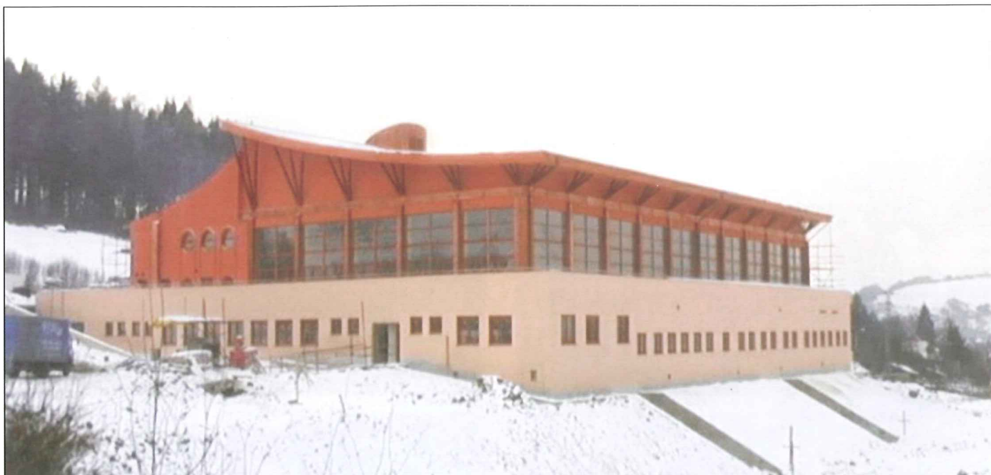
Výstavba nové sportovní haly.