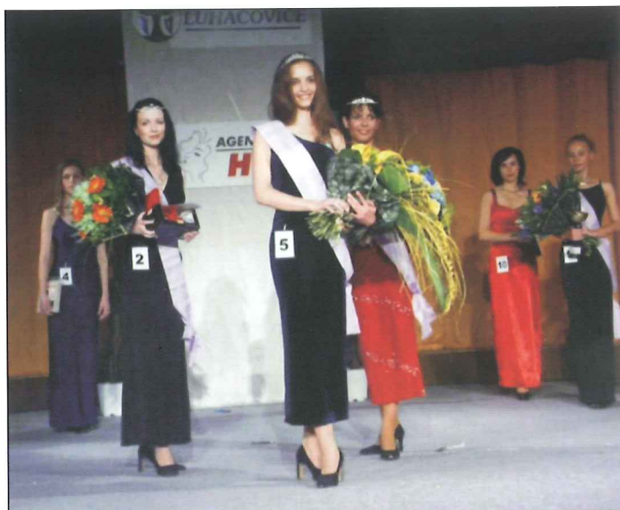
Finalistky soutěže MISS Luhačovice.