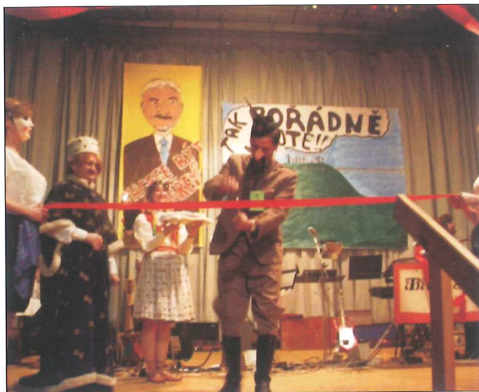
61. ŠIBŘINKY Ráz: "Všechna minulá tisíciletí"