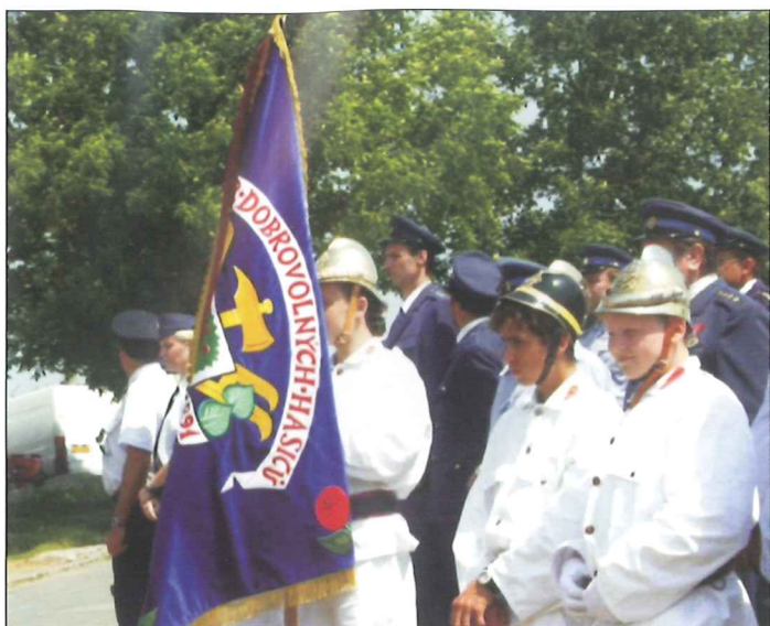
Hasiči oslavili v červenci 110 let od svého založení a posvětili nový prapor.